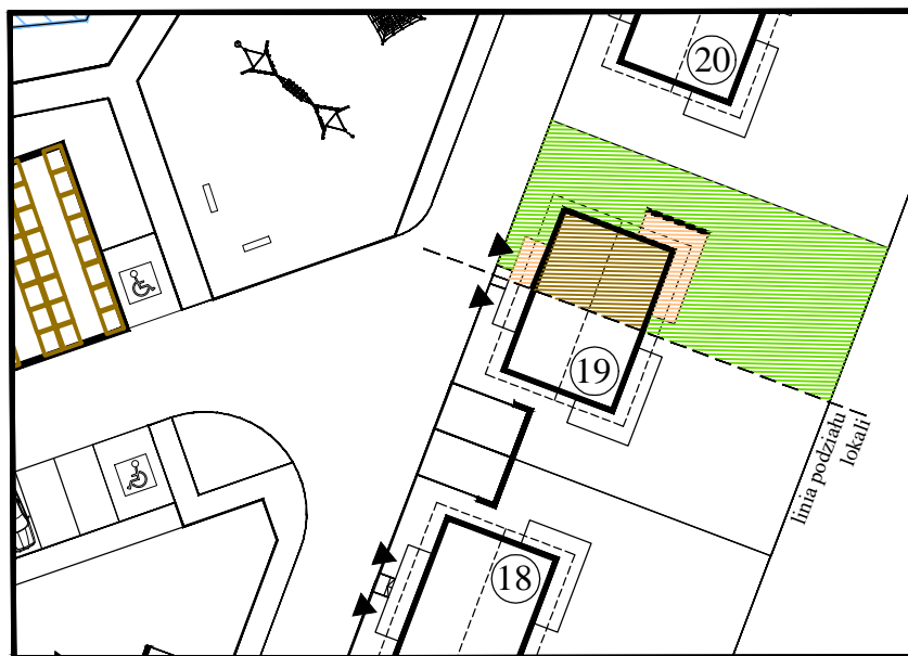
DOM NR 19 / LOKAL NR 1