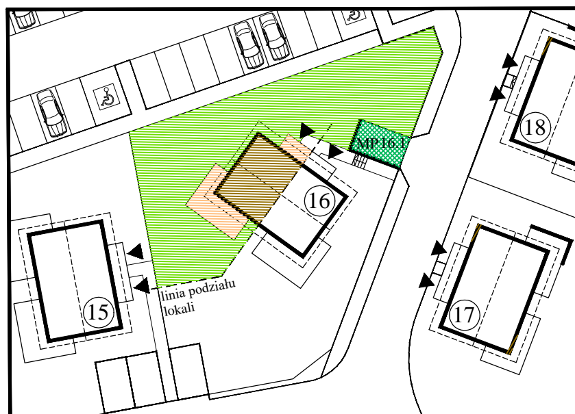
DOM NR 16 / LOKAL NR 2