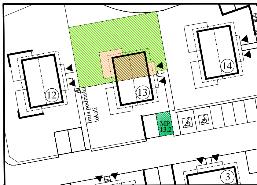
DOM NR 13/ LOKAL NR 2