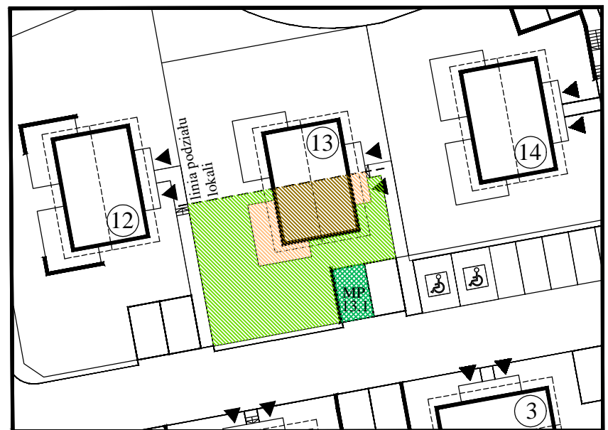
DOM NR 13/ LOKAL NR 1